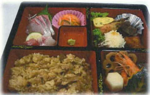
○昼食は「志気の鶏めし」