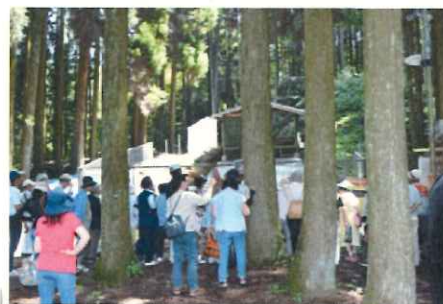
～古窯の森公園見学～出土品にも興味津々