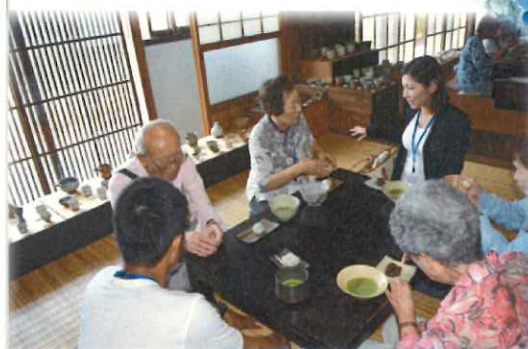
～草伝社で呈茶～ 甘いお菓子も大好評