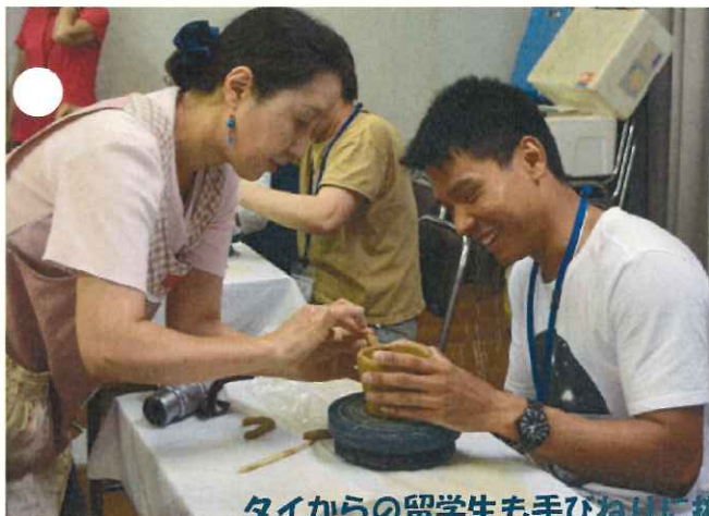
タイからの留学生も手びねりに挑戦(陶芸体験)