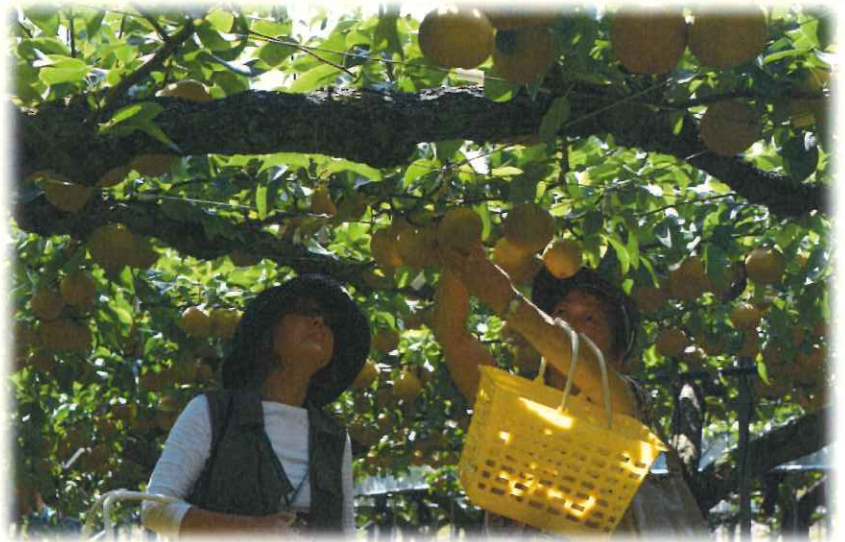
梨の収穫体験 試食ではみずみずしいと好評でした