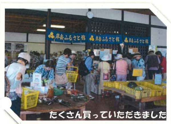
たくさん買っていただきました

「唐津焼発祥の里・北波多」の魅力を広く県外にPRするため、8月27日(日)にバスツアーを開催しました。福岡県からの参加者(先着40名)の皆さんに、梨狩りや陶芸体験などとおして、北波多を1日満喫していただきました。多くの皆さんから『ぜひ、また来たい。』と大好評でした。