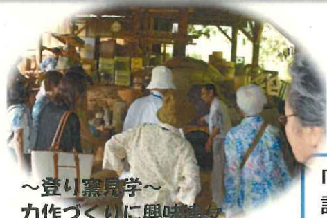
～登り窯見学～ 力作づくりに興味津々